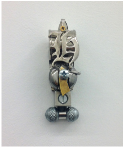
Masculus, 2016 metal 8 x 2,7 x 3 cm unique