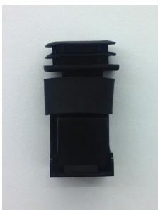
Shadow Lantern, 2016 plastic, wood, felt, rubber 7 x 4 x 2,8 cm unique