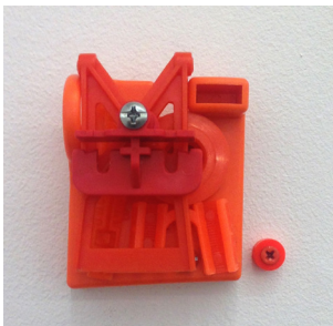
Mister, 2016 plastic, metal 6,2 x 5 x 4,5 cm unique