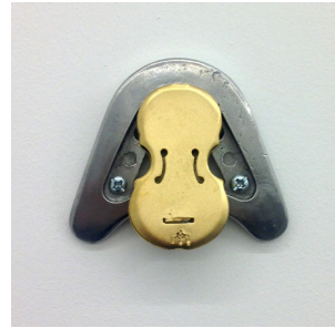
Madame Anime, 2016 metal 6,2 x 7,5 x 1,6 cm unique