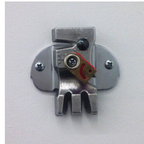
Clause, 2016 metal, felt 6 x 6,3 x 1,2 cm unique