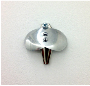
Vul, 2016 metal 3,8 x 3,8 x 0,8 cm unique