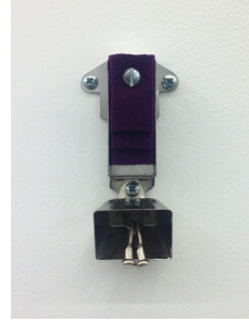
Colling, 2016 metal, felt 7 x 3,5 x 1,9 cm unique